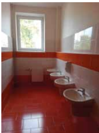
Foto: Toalety v novém kabátu.

29. června 2018 začaly po rozdělení vysvědčení dětem prázdniny a my měli dva měsíce na to, abychom provedli všechny stavební úpravy, které jsme si v průběhu roku naplánovali.