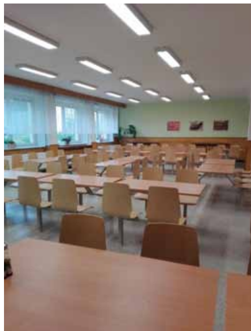
Foto: Nové sety v jídelně.