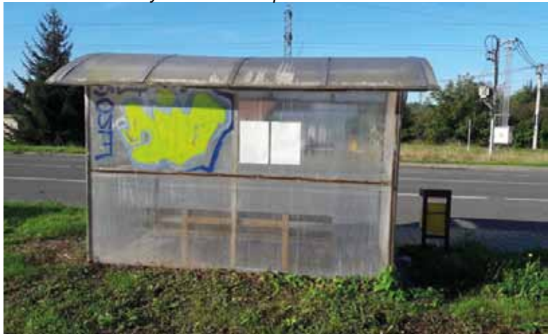
Foto: Zastávka nevydržela dlouho opravená.