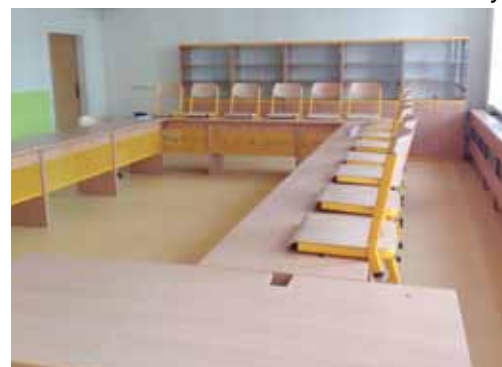
Foto: Rekonstrukce odborné učebny.