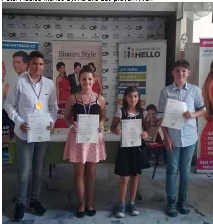
Foto: Rodiče mohou být na své děti právem hrdí.