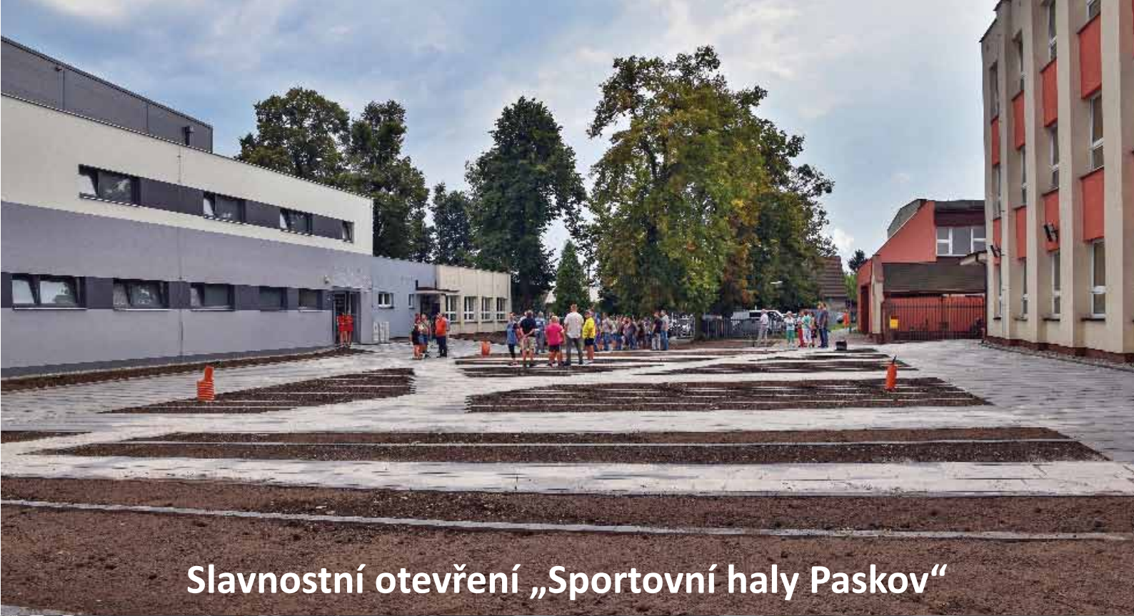
Slavnostní otevření „Sportovní haly Paskov“