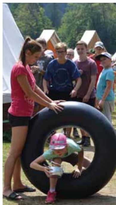
Foto: Oběd s překážkovou dráhou.