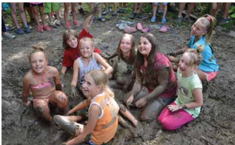
Foto: Boj v blátě pobavil soupeře i diváky.