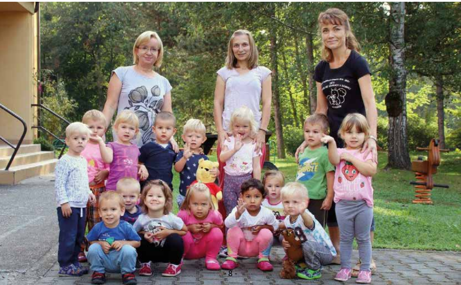
Foto: Děti z batolecí třídy Cipísek.

na nové kamarády. Děti musely zvládnout odloučení od svých nejbližších. Celý personál batolecí třídy za podpory vedení MŠ vynaložil velké úsilí, aby tyto nejmenší děti zvládly adaptaci co nejlépe, aby případných slziček bylo co nejméně. Po měsíci společné a oboustranné spolupráce mezi MŠ, dětmi a rodiči můžeme s radostí zhodnotit, že všechny děti zvládly adaptaci na výbornou. Je to především tím, že MŠ nabízí dětem stabilní, bezpečné zázemí a láskyplnou náruč :-).