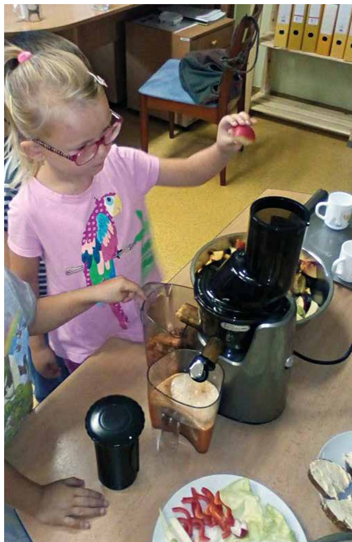
Foto: Děti si samy vyrábí šťávu z čerstvého ovoce.