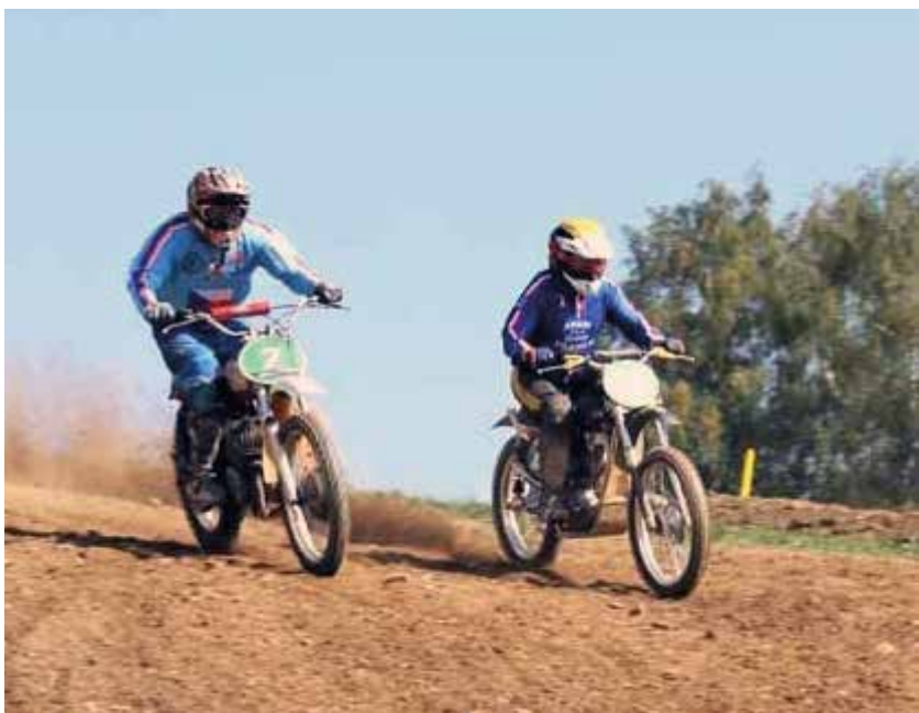
Fota: Hanáček v akci.