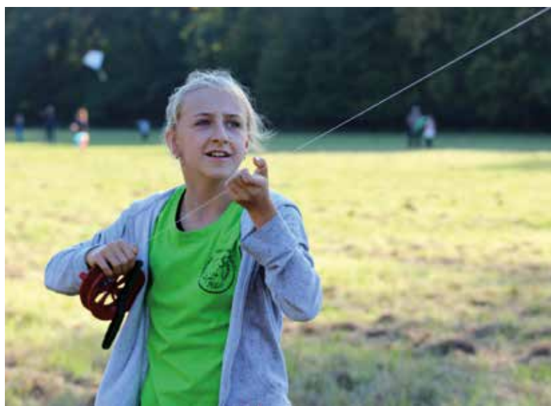
Fota: Počasí drakiádě po několika letech opět přálo.