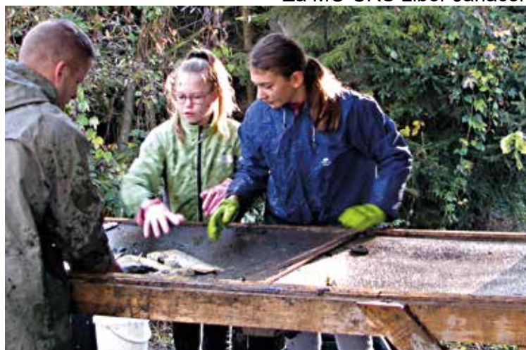
Foto: Při výlovu pomáhají malí i velcí.