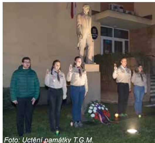
Foto: Uctění památky T.G.M.