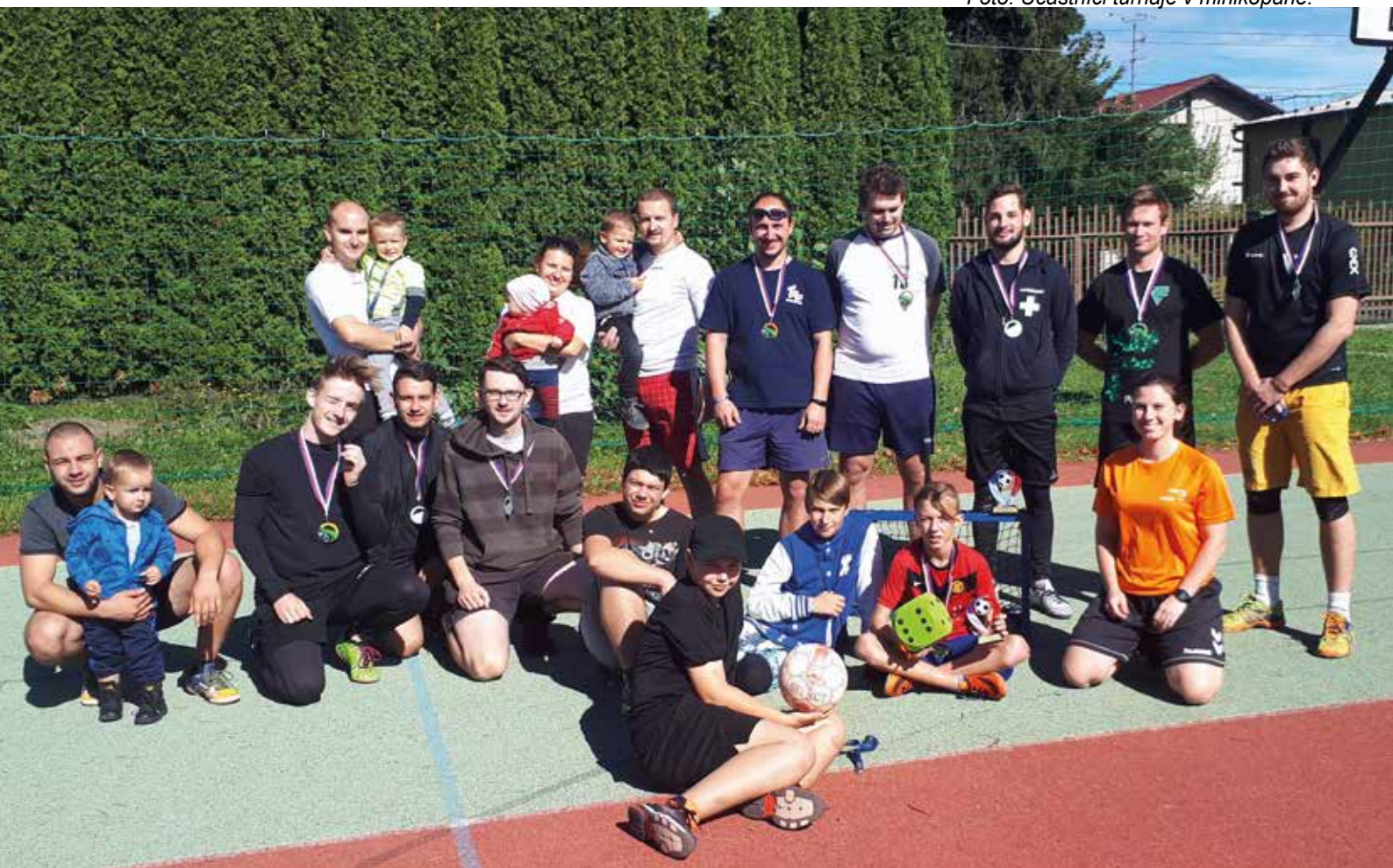
Foto: Účastníci turnaje v minikopané.