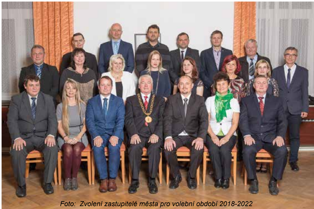
Foto: Zvolení zastupitelé města pro volební období 2018-2022