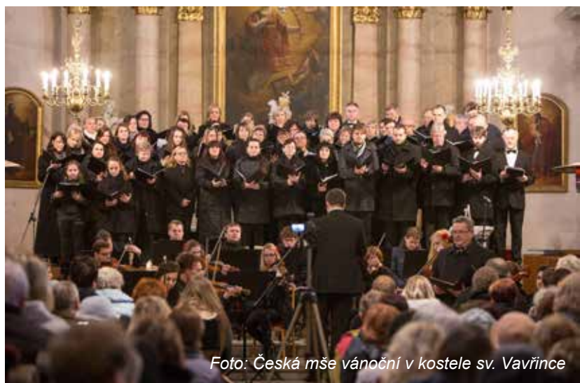
Foto: Česká mše vánoční v kostele sv. Vavřince