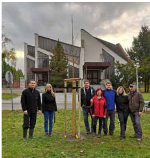
Foto: Vysazení lípy členy FV

Na základě oslav 100 let založení republiky, vysadili členové finančního výboru (FV) k této události pamětní strom.