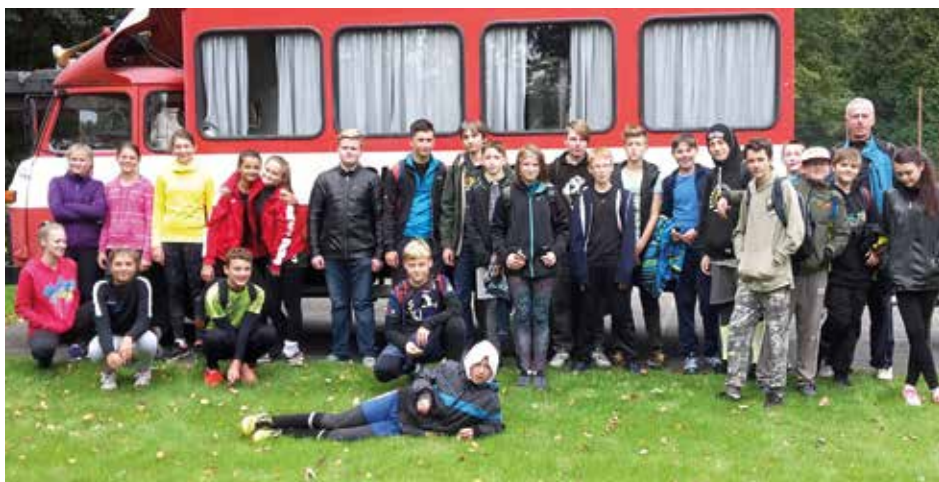
Foto: Branný závod měl úspěch.