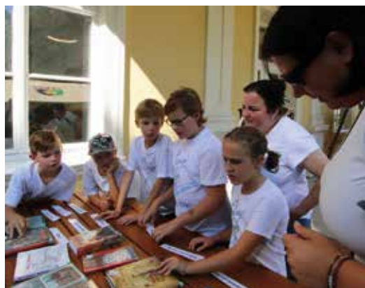
Foto: Jedny z disciplín soutěže.