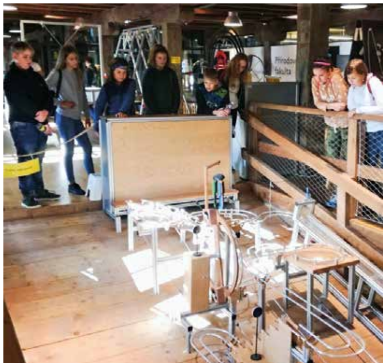
Foto: Úžasná věda pod záštitou MAP II.