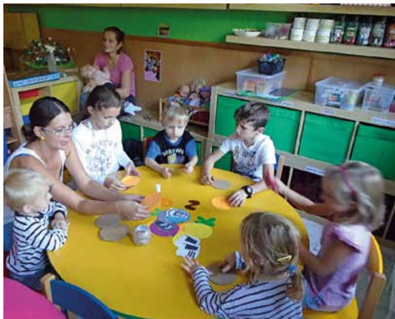
Foto: Práce dětí v Ekotýmu.

* Mám možnost ovlivnit prostředí ve třídě? Mohu přinést na nástěnku svůj výkres, svou myšlenku nebo nápad? Mohu přispět k výzdobě třídy svým výrobkem