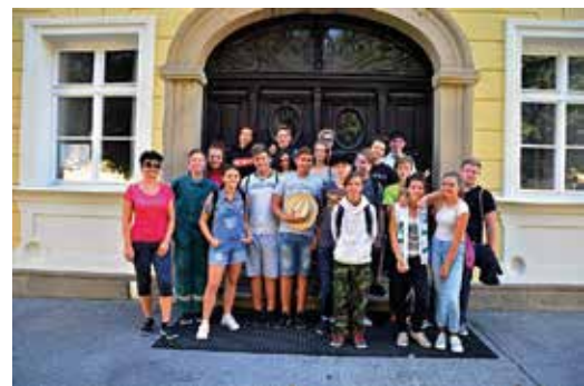
Foto: Velcí pomocníci.