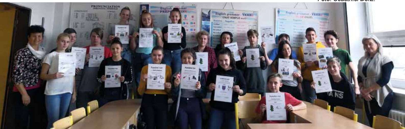
Foto: Účastníci DofE.

PS : Protože do prosince je daleko a já uznávám pravidlo, že po výkonu má být zhodnocení a odměna pokud možno hned, tak jsme se sešli a za přítomnosti paní ředitelky si žáci převzali pamětní listy, na kterých měli obrázkem ztvárněny aktivity, které plnili, některé pomohli vyrobit žáci 9. A a někteří si je pro sebe navrhli sami. Ti, kteří splnili jen expedici a aktivity vzdali, dostali také pamětní list, ale jen s obrázkem stanu. Všichni úspěšní absolventi Mezinárodní ceny vévody z Edingburghu dostali i symbolickou bronzovou fidorku. Opravdické ocenění – odznak a certifikát obdrží na slavnostní ceremonii v Praze.