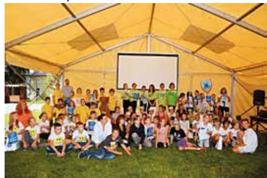
Foto: Všichni účastníci KnihOlympiády.