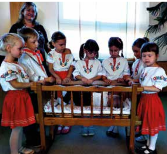
Foto: Vítání občánků.

„Milý tatínku a milá maminko! Narodilo se vám překrásné miminko...“ Takto hezky uvítaly děti ze třídy Ferda Mravenec a Krteček v sobotu 13. 10. 2018 v obřadní síni na Městském úřadě nové občánky města Paskova.