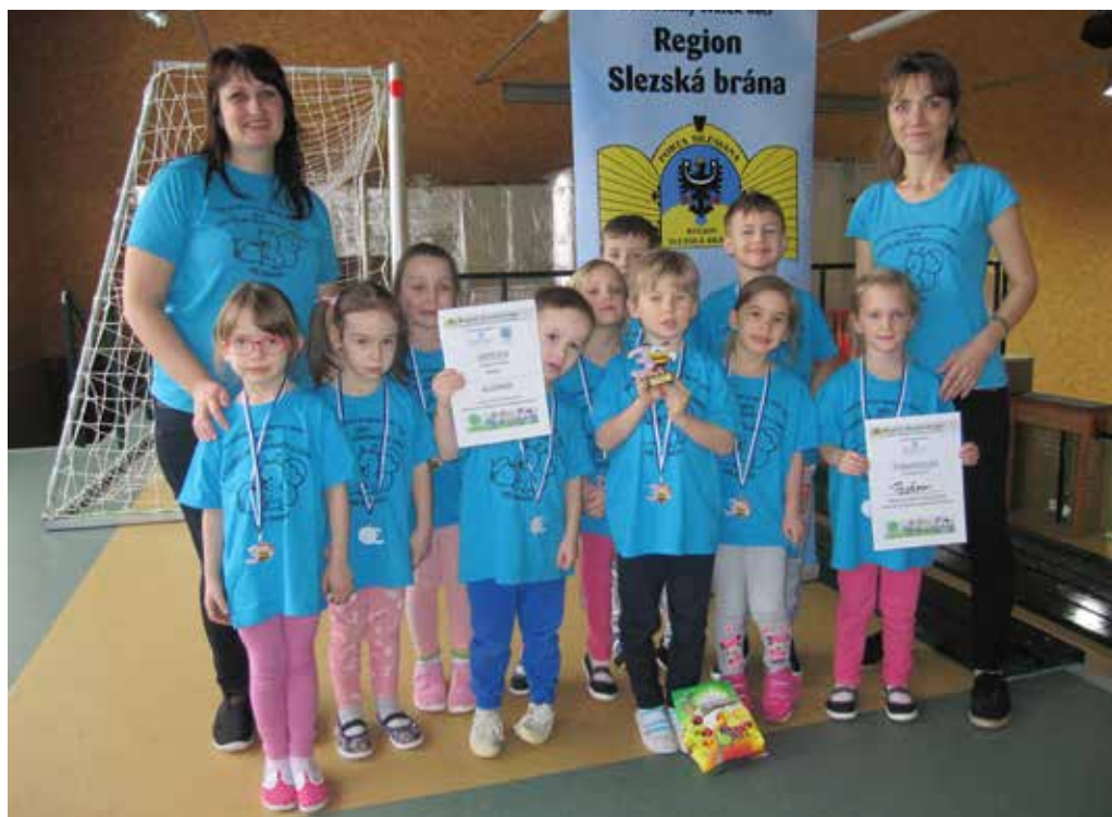
foto: medaile a diplomy za 3. místo