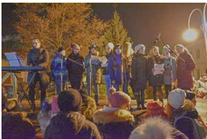
foto: Vystoupení sboru starších žáků

Od letošního školního roku mají naši žáci možnost setkávat se ve školním pěveckém sboru. Vznikly nakonec dvě skupiny. V mladší zpívají žáci 1.- 4. ročníku, ve starší pak žáci 5.- 7. ročníku. Schází se jednou týdně po vyučování a společně nacvičují zimní a vánoční písně. Mladší děti zpívají česky, mají pouze jednu slovenskou koledu. Ti starší pak se naučili koledy z USA, Mexika, Francie a také z Čech. Ve středu 5. prosince se mohli poprvé představit široké veřejnosti na slavnosti Rozsvícení vánočního stromu, kde vystoupily s krátkým programem oba sbory. 18. prosince 2018 se uskutečnil společný vánoční koncert pro rodinu a známé, kde ukázali, co se za poslední měsíce naučili.