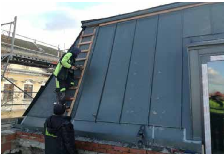
Klempířské práce na střeše budovy