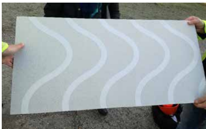
Vzorek sklobetonové desky obkladu fasády