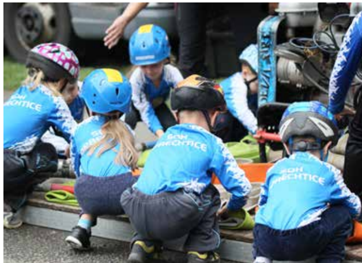
foto: MINI žáci na domácí soutěži

Kategorie MINI, děti ještě předškolního věku, se letos zúčastnila pouze 2 soutěží a to z důvodu hlavně velké absence členů na počátku sezóny. Ovšem již nyní, v zimě, to vypadá, že se nám klube poměrně silná generace nástupců.