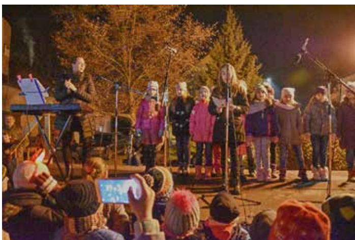
foto: Vystoupení sboru mladších žáků