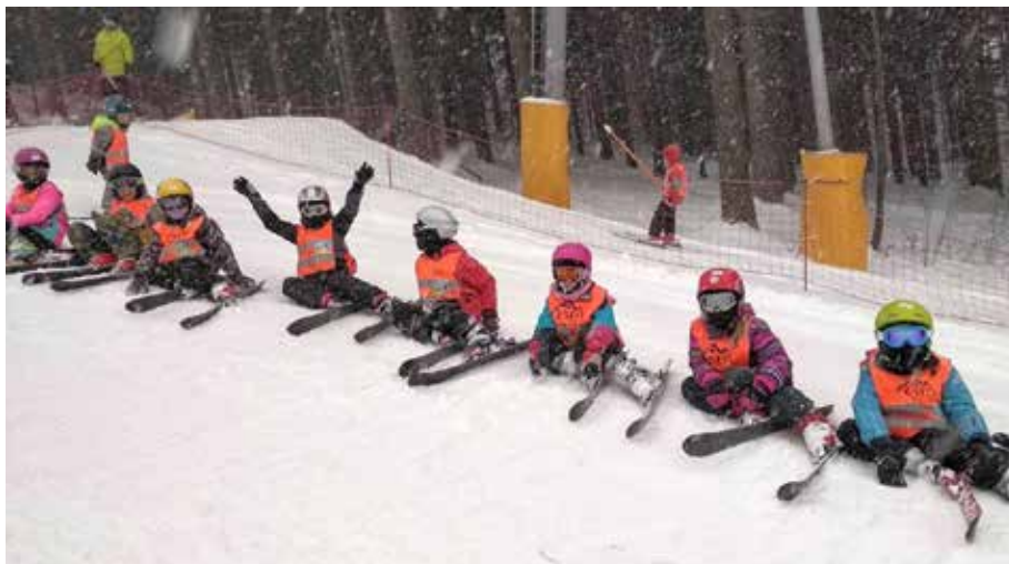
foto: Lyžařský kurz 1. stupně - odpočinek na svahu

V týdnu 14.1. – 18.1. jezdilo 29 dětí z prvních, druhých a třetích tříd ZŠ na odpolední lyžařský kurz do Malenovic. Dopoledne se učily a po obědě vyměnily školní oděv za lyžařské oblečení, aktovky za batůžky se svačinou a ve 12,15 odjížděly autobusem společně s dětmi z mateřské školy. Pod vedením instruktorů organizace JAPASPORT každý den 2 hodiny strávily na lyžích. Instruktoři byli velmi trpěliví a obětaví, a tak se děti každým dnem ve svých lyžařských dovednostech zdokonalovaly. Nejdříve všichni začínali na malé sjezdovce „Školák“ a postupně se družstva přemístila na velký svah „Mamut“.