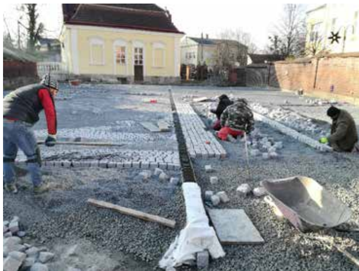
Pokládka žulové dlažby parkoviště