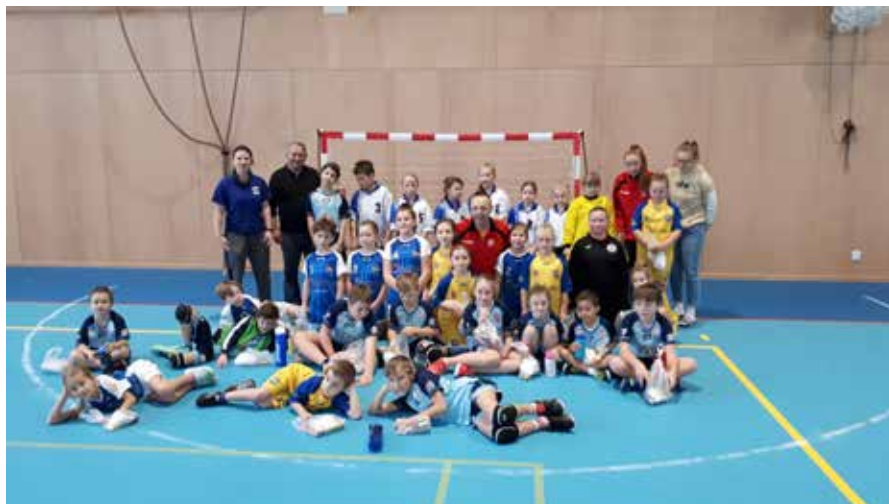
Účastníci turnaje O Paskovského kapra 2018

Tou druhou prosincovou akcí je na Štěpána tradiční již čtrnáctý ročník ve stolním tenise neregistrovaných hráčů. Zde se scházejí již pravidelní účastníci této akce, ale vždy se objeví nové tváře, které ožijí sestavu nadšenců. Tentokrát se sešlo jedenáct vyznavačů tohoto sportu, jeden účastník byl za Slovenska, a systémem každý s každým si zpřijemnil sváteční odpoledne. V potu tváře každého z nich bylo znát úsilí, s jakým zápalem chtěli docílit co nejlepší výsledek se soupeřem. Po téměř tříhodinovém zápolení byly známy konečné výsledky. Po mnoholeté nadvládě stejného vítěze došlo ke změně. Všichni zúčastnění byli odměněni hodnotnými cenami a vítěz převzal putovní pohár. Výsledky této motivační akce pro veřejnost: