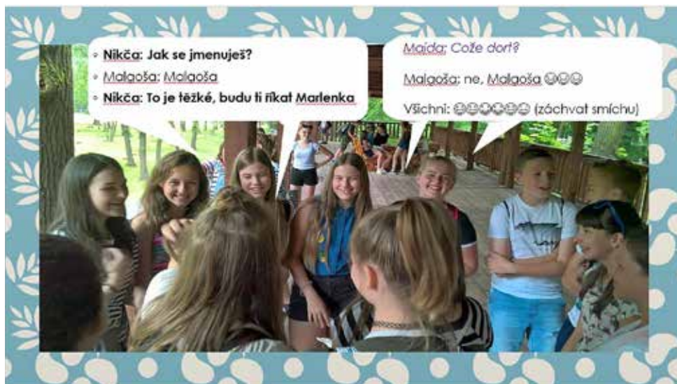
Ukázka ze soutěžní prezentace

Jelikož se jednalo o první ročník soutěže, věřím, že v dalším ročníku zúročíme nasbírané zkušenosti a budeme mezi vítězi.