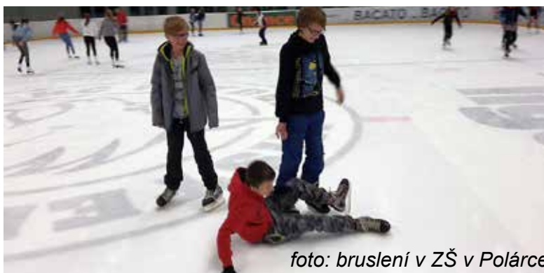
foto: bruslení v ZŠ v Polárce