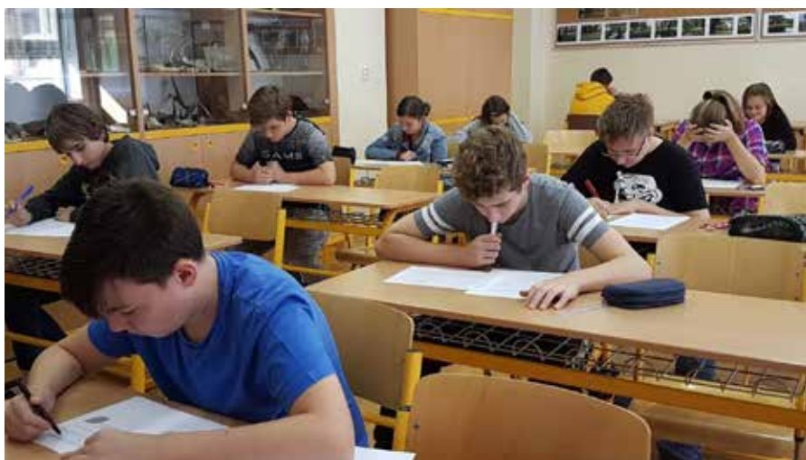
foto: Vypracovávání testu Přírodovědného klokana