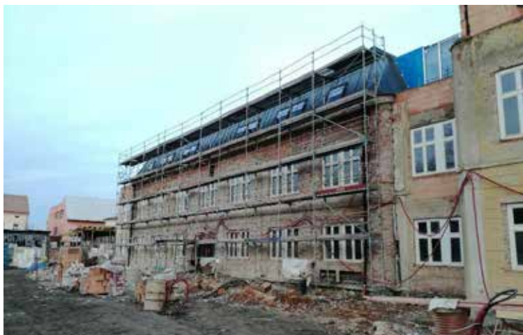
Celkový pohled na staveniště budovy