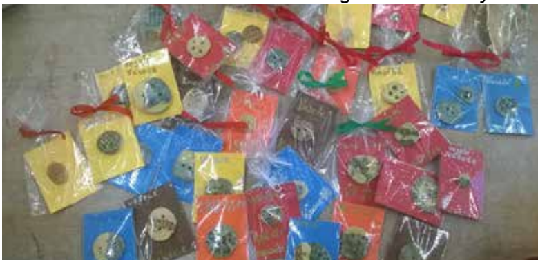
foto: Výrobky keramického kroužku